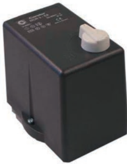
MDR 3 mit EA